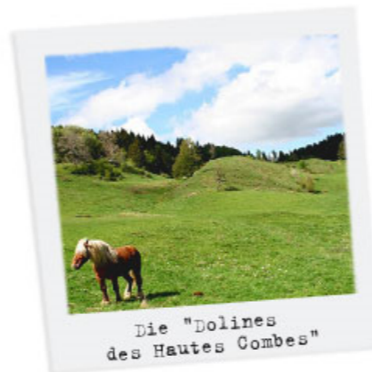
Die "Dolines des Hautes-Combes"

fast könnte man vergessen, welche Anhäufung zerklüfteten Kalkgesteins und anderer geologischer Seltsamkeiten das Jura ist! Sehen Sie sich, um sich davon zu überzeugen, die "Gorges du Flumen" (steiler Felseinschnitt, der sich über mehr als 4 km zwischen Lajoux und Saint-Claude hinzieht), den "Lapiatz de Lulle" (enorme geaderte erodierte Kalksteinplatte bei Champagnole) oder die "Dolines des Hautes-Combes" (für die Karsterosion typische große geschlossene Trichter) an. Besuchen Sie drei auf einen Streich!