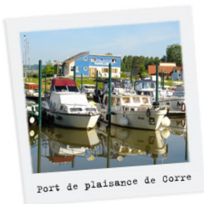
Port de plaisance de Corre