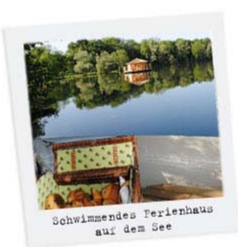
Schwimmendes Ferienhaus auf dem See

Steigen Sie in das Boot an Ihrem privaten Bootsanleger und legen Sie an der Terrasse Ihres runden, ganz aus Holz gebauten Zimmers auf dem Wasser an. Hier können Sie die großartige Darbietung der Natur und ihren wundervollen Soundtrack hautnah miterleben. Vögel, Fische, Lichtreflexe - einfach idyllisch. Aperitif, Abendessen und (königliches!) Frühstück werden am Bootsanleger angeliefert. Ein Erlebnis für Verliebte, ein Abend, eine Nacht und ein früher Morgen... die Sie garantiert nie vergessen werden.