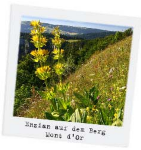
Enzian auf dem Berg Mont d'Or

Diese Blüten werden von der Pflanze erst nach sieben Jahren entwickelt! Ein Zeichen, dass die Wurzeln aus der steinigen Kalkerde auch die entsprechende Rauheit und den Charakter ziehen. Es sind diese Wurzeln, die destilliert werden. Der echte Geschmack der Berge und kräftigende, fast medizinale Eigenschaften charakterisieren diesen ganz in der Region verankerten Verdauungstrank mit seinen intensiven Aromen. Eine begreifliche Intensität, wenn man bedenkt, dass eine Wurzel, die 2 kg wiegt, dafür 15 Jahre gebraucht hat und dass für 1 Liter Schnaps 13 bis 16 kg erforderlich sind. In der Schnapsbrennerei Michel in Chapelle-des-Bois (seit 1888) erfahren Sie alle Geheimnisse des Enzianschnapses.