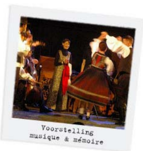
Voorstelling musique & mémoire