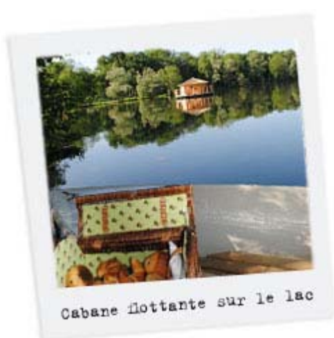
Cabane flottante sur le lac

Depuis votre ponton privé et sa barque, accostez sur la terrasse de votre chambre ronde et tout de bois posée sur l'eau. Vous voici aux premières loges du grand spectacle de la nature et de sa fantastique bande-son. Les oiseaux, les poissons, la lumière changeante, le tableau est idyllique. Apéritif, dîner et petit déjeuner (de roi !) vous sont livrés au ponton. Une expérience à vivre en amoureux pour une soirée, une nuit et un petit matin... Assurément inoubliables.