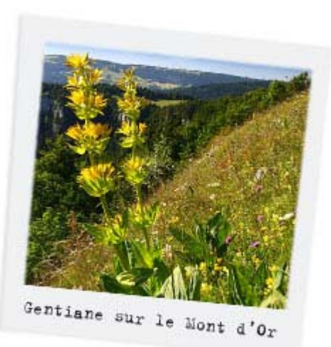
Gentiane sur le Mont d'Or

Des fleurs que la plante ne développe pas avant sept ans ! Signe que les racines ont puisé dans la terre caillouteuse et calcaire sa rudesse et son caractère. Ce sont ces racines que l'on distille. Un vrai goût de montagne et des vertus toniques quasi médicinales pour ce digestif très terroir et concentré en arômes. Une concentration légitime lorsqu'on sait qu'une racine atteint 2 kg en 15 ans et que 13 à 16 kg sont nécessaires pour élaborer 1 litre d'eau-de-vie. Tous les secrets de la gentiane vous sont révélés à la Distillerie Michel à Chapelle-des-Bois depuis 1888.