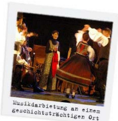
Musikdarbietung an einem geschichtsträchtigen Ort